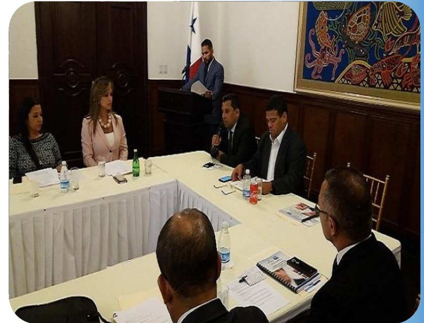
Instalación y Presentación de la Junta Técnica y Rectora de Carrera Administrativa